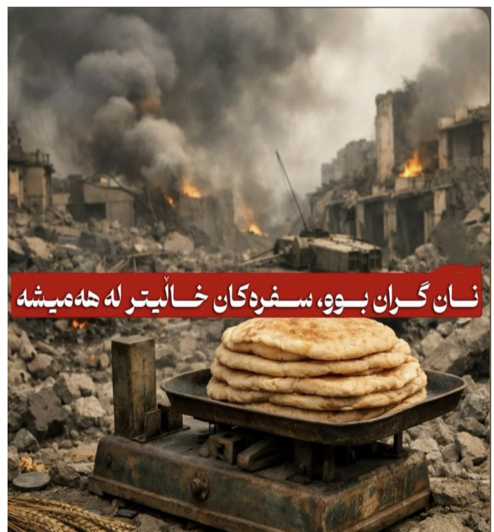
نان گران بوو، سفرەکان خالیتر له هەمیشە

جەنگى ۴۰ رۆژە كۆتایى ھاتوو، بەلام سێبەرەكەى ھىشتا بەسەر ژيانى رۆژانەى خەلكى ئێرانەو قورسایى دەكات. ئەگەر له رۆژانى شەردا، نینگەرانى سەرەكى بریتى بوو له تەناھى و مانەو، له ھەفتە و مانگەكانى دواى ئەوھدا، كێشەى سەرەكى بۆ ملیۆنان بنەمالە بووتە بژىوى ژيان. گرانى بێداد دەكات و سفرەى خەلك رۆژ له دواى رۆژ بچووكتەر دەبیتەو. لەم نۆیەندەدا، نان، ئەم سەرەتاییتترین و بنەرەتیتترین كالاى خۆراکییە، بووتە ھىمايەكى روونى قەیرانى بژىوى له ئێرانى دواى شەر. نان له كۆلتوورى ئێرانىیدا تەنیا ماددەپەكى خۆراكى نییە، بەلكوو نان واتە لانیکەمى ئیمكانى ژيان. كاتىك دەوتریت كەسێك «نان ھینەرى» بنەمالەپە، واتە بارى بژىوى مالەكەى لەسەر شانە. بەم ھۆیەو، گرانبوونى نان تەنیا زیادبوونى نرخى كالاپەك نییە، نیشانەپەكە لەوھى كە فشارى ئابوورى گەیشتوووتە قوولترین لایەنەكانى ژيانى خەلك.