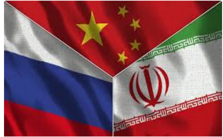
عوسمانی حاجی مارف

تهقلیدیهکانی وزه، ئەمەش له درێژخایه‌ندا زیان به به‌رژه‌وه‌ندیه‌کانی روسیا ده‌گه‌یه‌نیت.