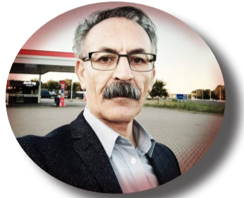
ن: گهریم ئەمانی