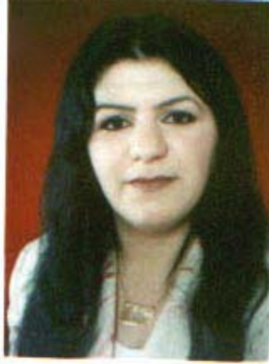
بههار مه جمود

گه ره ڪيهه تي سهرم بڪيشي به ديواڙي شهوا، شهو! ! ٽه مهه دواين برياري ڪچيڪ نيهه... دواين شورشه ڪاڻي خانزاد و چهپسه خان و عاديله خانم نيه هاورئ ٽه مهه هواره بو به تفرې ويژدان! هوار بو به ههدهر بردني عهقل و مهعريفه، هواره بو چنگ كهوتني بوونيهه تي ڪچيڪ ٽه شي ڪوشڪي خه يالات تا بي و سهر له سهفقي ناسمان بچه قيني و به رهه يونيڪ نه کاته په ناگه هاورئ؟ من بينيم له په نجهه ره ڪاڻي خواوه هه رچي دا يڪه باخچه ڪاڻي به هاري خوا ٽه گهريڻ و به راءت ٽه به خشنه هواسه ره دل رهقه ڪاڻيان... له ويٽوه به پوستي ره همتا نور به دياري ٽه نيڙنه وه! داخم له خهوني ڪچيڪ، چ زوو راءه چله ڪئ له به ردهم ره هيله زهنديقي رڙگاردا... من هه ميشه گيرفانه ڪام پرن له تووه سپيهه ڪاڻي پاڪي و... گه لا سهوزه ڪاڻي به خشندهي... هه ده ڪوشم زهه مبيله ڪاڻي خوزگهه بو پر ناڪريڻ له شيله ي چرڪه ٽيواره عاشقه ڪان و... سيڙهري داره زرافه ڪان... خهريڪن سه رسهرم جيده هيلن هاورئ! بينيم شهو ڪز ڪز هه لخراره به ته نافي هه وشه كه مانا... به ديوار قه تاره ي سپيده وه، ٽاخو ڪه ي دئ به ڪوئي چاوه روانييه وه... تا ٽه ستيره ڪان دهنك، دهنك نه وه رنه سهر بالاي خاك ٽوف له خهوني ڪچيڪ... ڪئ دهلئ ٽه ڪاروانه هه ر دئ؟ له بازگه ي پياوسالارييه وه ناتوانم سنوور بپر! چونكه رهنگم له رهنكي ناسنامه ڪه ي بهر باخه ٽ نيهه هاورئ