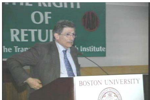
و: ب- مازیار

ٹیدوارڈ سه عید، تویژهر، ره خنه گری ته ده بی و بهرگری كه ری شیلگی ری مافی دیاری كردنی چاره نووسی خهلكی فهلهستین، رۆژی چوارشه مه ريكهوتی ۲۴ سپته مبه ر پاش بهر بهر كانی به كی زؤر له گه ل نه خویشی سه ره تان، له ته مه نی ۶۷ سالیدا كؤچی دوایی كرد.