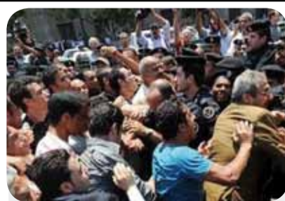
ئه‌دوونیه‌کانی سهر زه‌وی، غه‌زهل وێژانی سوویه