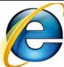
برینی شه‌به‌که‌ی ئینتیرنییتی جیهانی و وه‌کارخستنی شه‌به‌که‌ی ئینتیرنییتی (میلی)!!