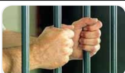
چی به‌سه‌ر زیندانیانی نه‌خۆشی نیو زیندانه‌کانی کۆماری ئیسلامی دیت؟