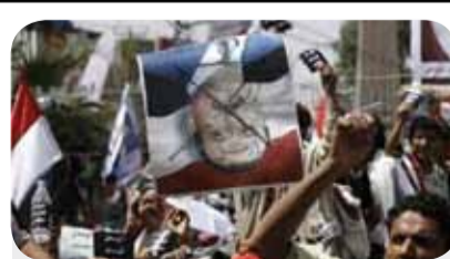
سه‌رکه‌وتنی خه‌لکی یه‌مه‌ن، له‌ گره‌وی به‌رده‌وامی و قوتتر بوونه‌وه‌ی خه‌باتی یه‌کگرتوانه‌یان دایه