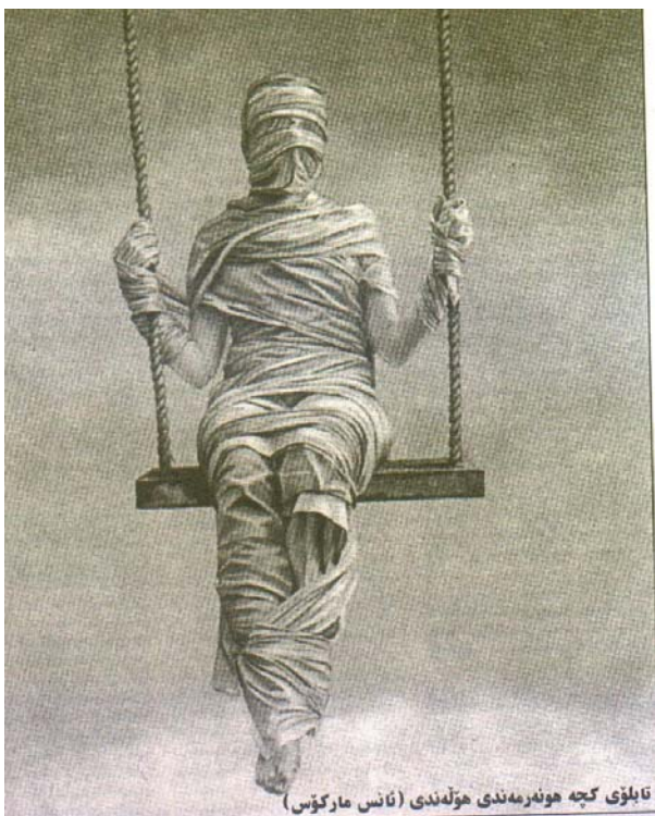
تابلوی كچه موندەندى ھۆلەندى (ئانس ماركوس)

بۆيە دەكرىت بلېين لە پال سەربەخۇ بوونى ئابووريدا ھوشيارىش خالىكى گرنگە، چونكە ئەگەر مېنيە خاوەنى ھوشيارىەكى وا نەبوو با لە رووى ئابووريشەوہ سەر بەخۇ بىت سوودى نىيە.