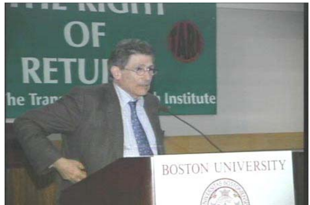
و: ب- مازیار

ٹیدوارڈ سه عید، تویژهر، ره خنه گری ته ده بی و بهرگری كه ری شیلگی ری مافی دیاری كردنی چاره نووسی خهلكی فهلهستین، رؤژی چوارشه مه ريكهوتی ۲۴ سپته مبه ر پاش بهر بهر كانی به كی زؤر له گه ل نه خؤشی سه ره تان، له ته مهنی ۶۷ سالیدا كؤچی دواپی كرد.